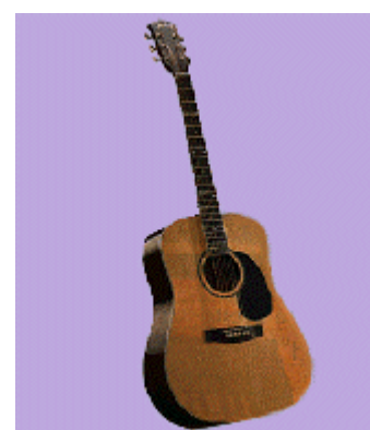
Figure 2 – Exemple d'objet : une guitare.