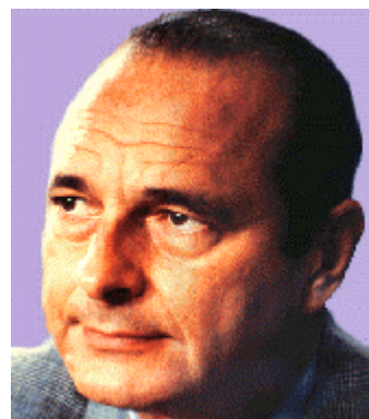
Figure 1 – Exemple de personne célèbre : J. Chirac.

Les images sont en couleur. Les visages et les objets y apparaissent tous sans contexte, sur un même fond. (voir figures 1 et 2).